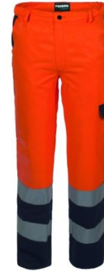
21 - ORANGE/BLUE