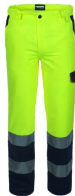
42 – GIALLO/BLU