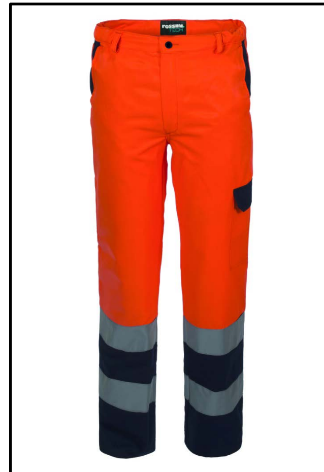
21 – NARAJA/AZUL