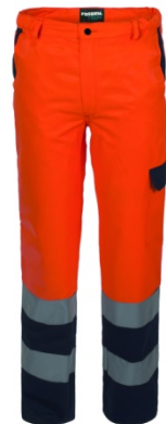
21 – ARANCIO/BLU