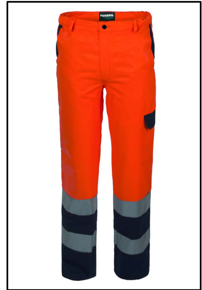
21 - ORANGE/BLUE