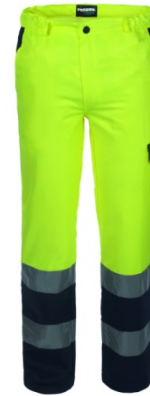
42 - YELLOW/BLUE